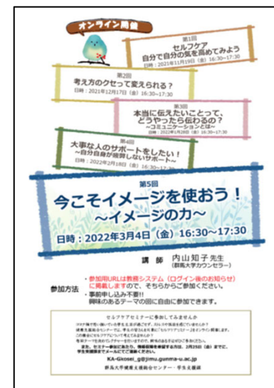
(上図) セルフケアセミナー