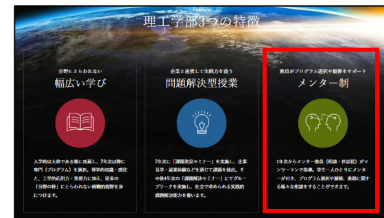
（上図）理工学部3つの特徴