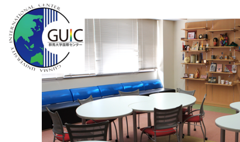
(上図) 国際センター