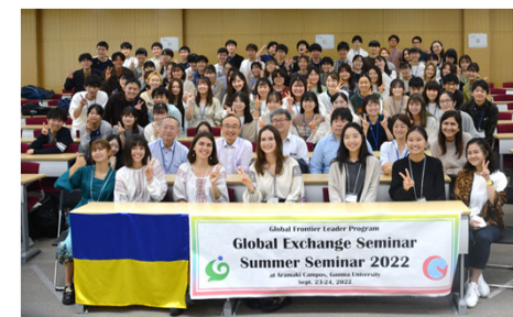
(上図) ウクライナ学生・研究者と本学GFL生との交流会