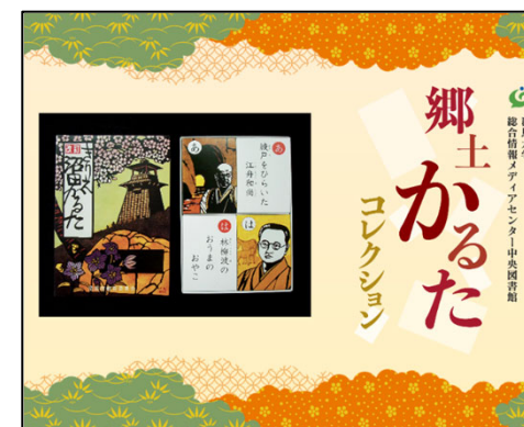
(上図) 「郷土かるたコレクション」デジタルアーカイブ